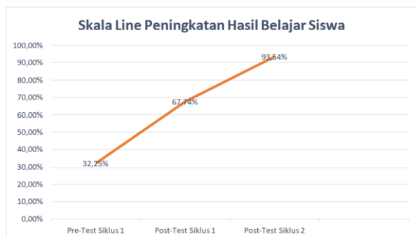
Gambar 2. Skala Line Peningkatan Hasil Belajar Siswa